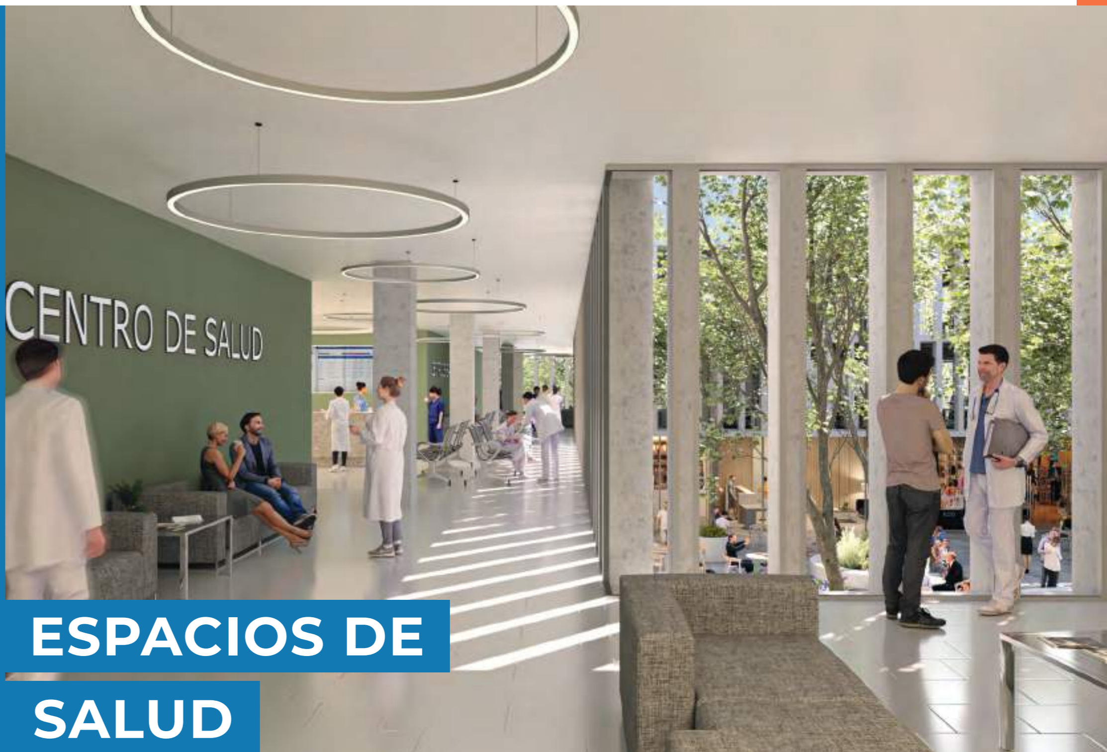
ESPACIOS DE SALUD